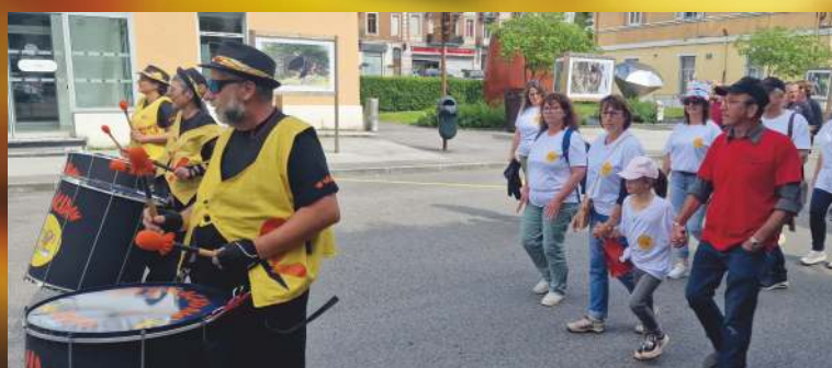
50 ème anniversaire de la fusion des communes (Chaumont, Chevry, Cinqétral, Ranchette, Valfin-lès-Saint-Claude et Saint-Claude), le samedi 25 mai dernier.