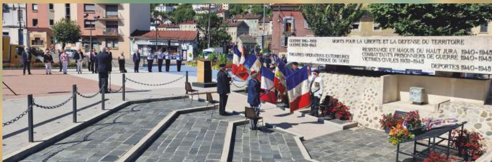
Commémoration du 80 ème anniversaire de la Libération de la Ville, lundi 2 septembre.