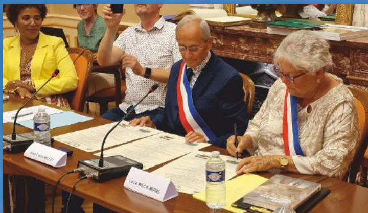
Signature de la charte