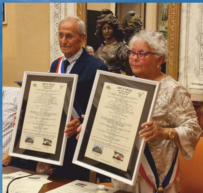
Présentation de la charte