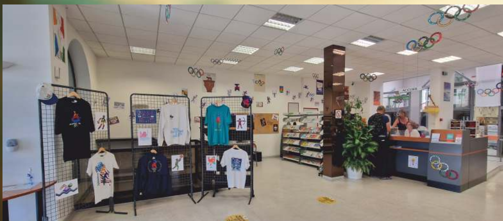
Une exposition inédite et temporaire sur le thème des Jeux Olympiques était visible cet été au Centre Communal d'Action Sociale de Saint-Claude.