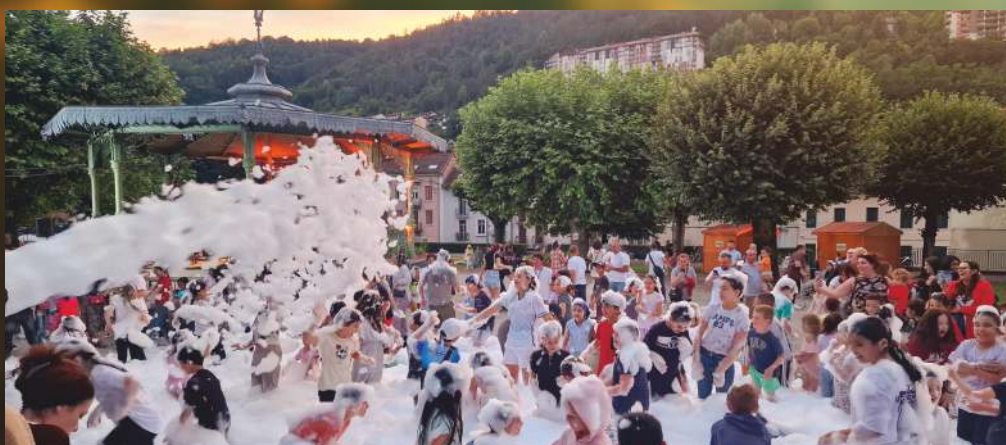
Jamais deux sans trois ! Franc succès pour La Ri'Botte Festival #3, début juillet.