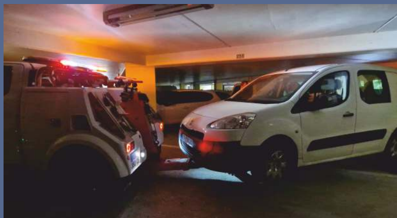
Enlèvement d'un véhicule à la Côte Joyeuse

Concernant ces deux missions, merci à notre Police Municipale pour sa réactivité et son efficacité.